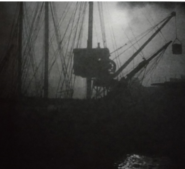
Figura 3. Fotograma de dársenas industriales y veleros a la antigua

Se preguntaba, por ejemplo, cómo dar en el filme la imagen concreta (se trata, una vez más, de la escena de duelo ante el cadáver de Vakulinchuk) de una “imagen literaria” como la siguiente: “un silencio de muerte estaba suspendido en el aire”. (Didi-Huberman, 2017, p. 221)