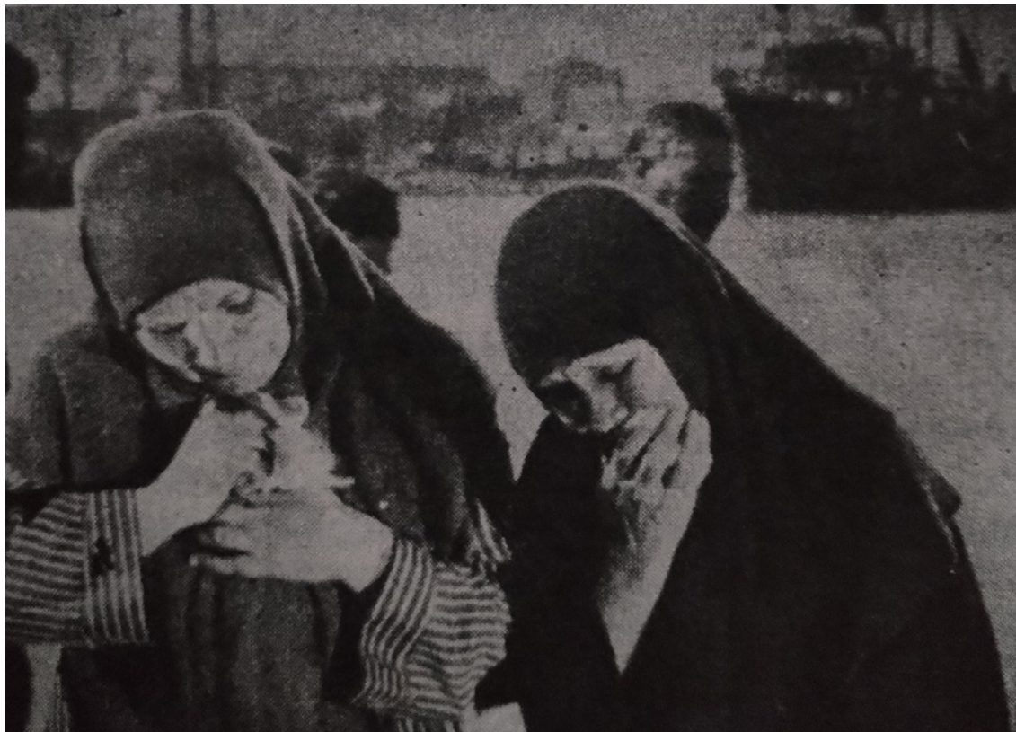
Figura 4. Fotograma de mujeres sollozantes lamentan la muerte de Vakulinchuk

esa multitud que converge hacia el puerto, etc.— que la constituyen. Es la imagen en tanto trasgrede los límites de su propia apariencia singular, en tanto impacta, afecta —incluso infecta— el todo de lo sensible y el todo de lo inteligible a la vez. Al término de ese movimiento expansivo o transgresivo, que Eisenstein pronto denominará “éxtasis” ( ekstaz ), la obraz , deberá entenderse como un proceso estético, sin fronteras. (Didi-Huberman, 2017, p. 246