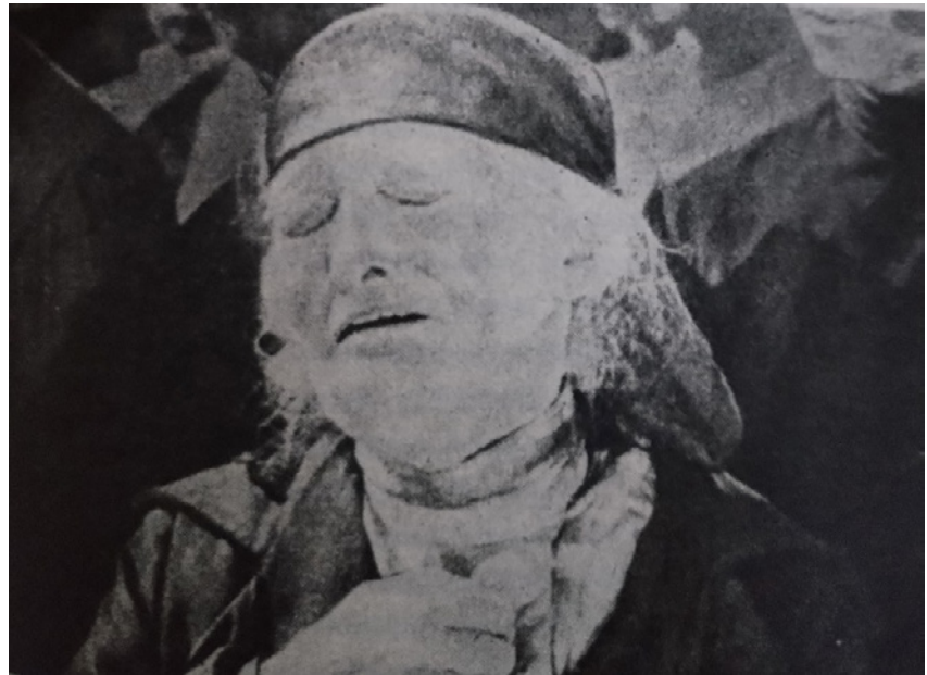
Figura 2. Fotograma de una mujer sollozante

Fuente: Sergei M. Eisenstein, El acorazado Potemkin (1925).