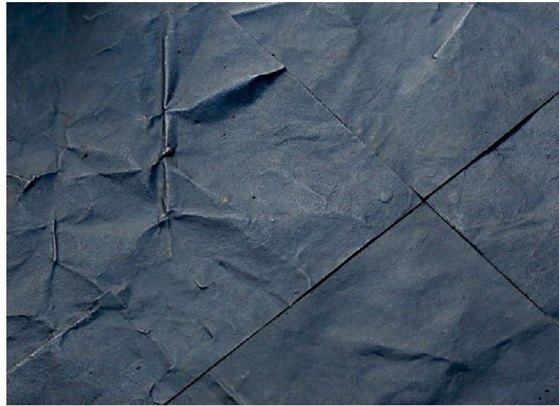
Figura 5. Fragments , Doris Salcedo

La obra de Doris Salcedo es un ejemplo de lo anterior. El sumario de violencia y despojo acumulado durante más de medio siglo de conflicto en Colombia encontró, parcialmente, una salida negociada mediante el acuerdo de paz suscrito entre la guerrilla de las FARC y el Estado colombiano, representado en ese momento por el gobierno del presidente Juan Manuel Santos. Con motivo del desarme de este ejército insurgente, las armas fueron recolectadas por una misión oficial de las Naciones Unidas (ONU), para luego ser utilizadas como insumo para la elaboración de un artefacto histórico que hiciera memoria acerca del conflicto violento que ha desangrado durante décadas a la sociedad colombiana. Esta tarea fue encargada a la artista Doris Salcedo, quien, después de haber dirigido las labores de fundición del armamento entregado por las FARC, en conjunto con un grupo de mujeres víctimas de la violencia, dio forma a estas láminas de metal fundido, por medio de martillazos que representarían la crudeza y brutalidad de la guerra. Cada una de las láminas forjadas a martillazos conforma el piso sobre el cual se ha construido un espacio en el que se desarrollan diversas actividades culturales.