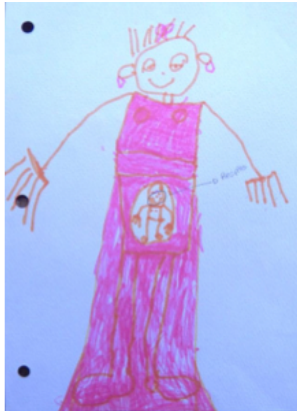
Figura 2. Representación de un niño de 5 años sobre la nutrición del feto.