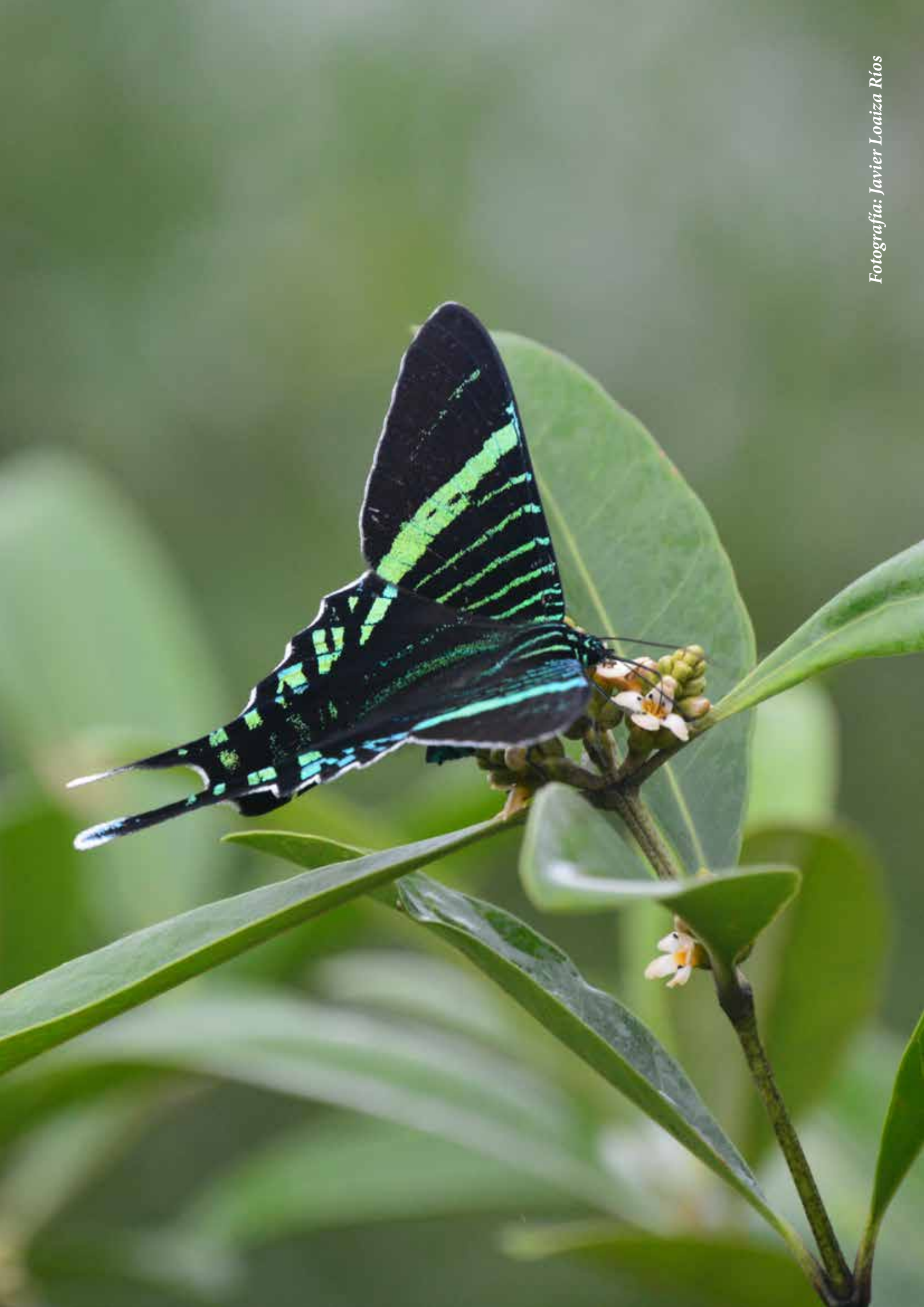
Fotografía: Javier Loaiza Ríos