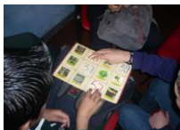
Figura 3 Estudiantes grado 8° y 9°

Memorias del VIII Encuentro Nacional de Experiencias en Enseñanza de la Biología y la Educación Ambiental. III Congreso Nacional de Investigación en Enseñanza de la Biología.