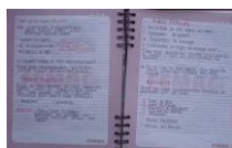
Figura 2. Ejemplo de una Bitácoras realizada por un participante del semillero

Con base en los saberes previos de los estudiantes se tuvieron en cuenta los siguientes aspectos: primero los beneficios de las plantas aromáticas medicinales, necesidad de recuperar valores medicinales de plantas que tradicionalmente son útiles para el tratamiento de síntomas; segundo cambiar hábitos de consumo de medicamentos químicos por productos naturales, que se encuentran al alcance de todos; tercero la importancia de relacionar conocimiento ancestral y científico de utilidad para la comunidad educativa. Para lo cual los estudiantes plantearon diversidad de preguntas que se fueron clasificando de acuerdo a la categorización de las mismas, que propone Hulley et al: descripción, explicación casual, generalización, definición, comprobación, predicción, gestión, opinión y valoración (COLCIENCIAS,FES-ONDAS, 2011 pág. 77) .