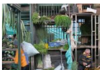
Figura 4. Vendedores de plantas aromáticas que voluntariamente colaboraron. Puesto de Plaza de Mercado Abastos

parque La Amistad de Kennedy Central, como también familiares y amigos de los integrantes del semillero e igualmente la consulta bibliográfica especializada en el tema etnobotánica. (Ver figura 4).