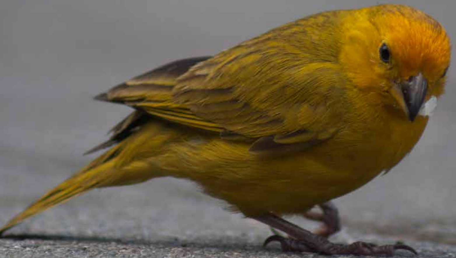
Fotografías Wilson Celis Ariza Licenciado en Biología. Especialista en enseñanza de la Biología UPN