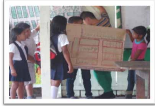
Foto 1: Estudiantes de Ciclo II haciendo explicación de los mapas sueño

espacio determinado donde se siembra diversidad de plantas (Mutumbajoy, 2013 Comunicación personal 30 de enero de 2013). En el primero exponían en un dibujo cómo se encontraba la huerta en la actualidad. En el otro mapa, debían señalar cómo debería ser la huerta en un tiempo futuro, dibujando las diferentes hortalizas que se deben sembrar en cada era.