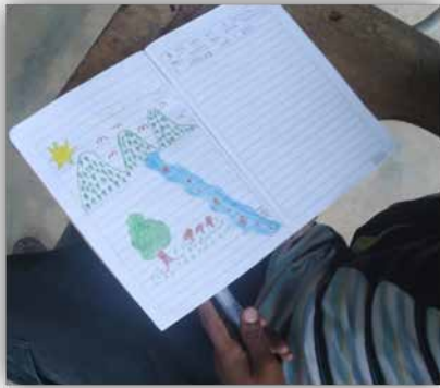
FOTO 2 y 3: estudiantes realizando dibujos en relación a la chagra

De acuerdo a esta actividad, foto 2 y 3 se observó que a través de los dibujos los niños explican todo lo que ven a su alrededor y su relación con –NukanchipaAlpa Mama- además que entienden el significado de la comunidad Inga, donde se expresa que la chagra es todo. En sus dibujos se demuestra que no solo es la huerta o el abono, si no es todo lo que sus sentidos pueden percibir y explorar; teniendo en cuenta la edad de los estudiantes. Ellos están en la capacidad de interpretar por medio de la oralidad los diferentes significados que le ofrece el medio, están en la capacidad de fortalecer sus conexiones, teniendo en cuenta su entorno y además establecer pautas de construcción de conocimientos por medio de lo que ven, saben, conocen y sienten.