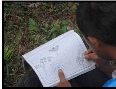
FOTO 7 Y 8: Estudiantes del ciclo II, realizando prácticas en la chagra, en relación a los recorridos territoriales

Para la organización de la actividad los estudiantes se organizaron en cuatro grupos, cada uno lleva sus materiales; la primera técnica utilizada era la observación de los seres y existencias como se muestra en la foto 7 , después dibujarlos en el cuaderno en relación al cuadrante que cada uno había escogido para realizar su interpretación de ese espacio; es importante resaltar el conocimiento que los estudiantes tiene en relación a las plantas que se siembran en el colegio, teniendo en cuenta que hay estudiantes nuevos, la capacidad de reconocer lo que ofrece un espacio determinado en relación al alimento, permite tener una relación intrínseca con el lugar en el cual se desarrollan diferentes pautas de aproximarse a la realidad, o de vivir el contexto que se despliega en la capacidad de sentir, pensar y actuar.