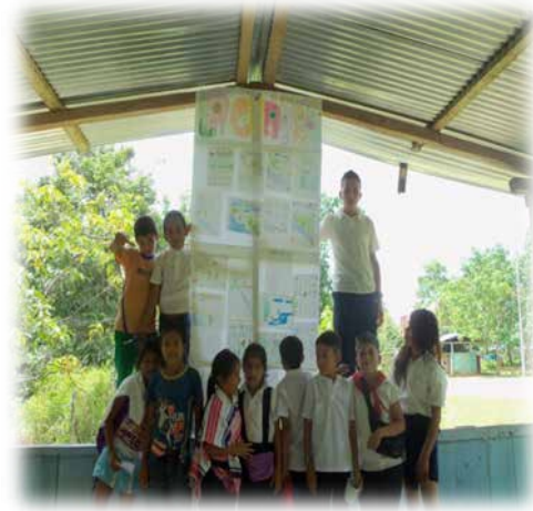
FOTO 4 Y 5: estudiantes del ciclo II, exponiendo el mural con los dibujos de la chagra

En la foto 4 y 5 , de acuerdo a la elaboración individual del dibujo, se observa que los estudiantes poseen patrones similares a la hora de expresar lo que observan y eso se identifica por la similitud en las imágenes, pero la construcción del significado de chagra para todos es diferente, pues algunos plasman lo que se identifica como chagra natural, o el río, el rastrojo, el monte, el agua; y otros plasman la chagra diseñada, en la cual se encuentran las diferentes huertas de plantas medicinales, de hortalizas, que ellos mismos cuidan y limpian. En el momento de la exposición los constructos y las ideas son similares, y esto se identifica por el significado que han aprehendido en el transcurso de la vivencia con los profesores de Yachaikury, y por las preguntas que ellos mismos hacen a los sabedores o Taitas; algo novedoso es que siempre expresan dichas construcciones, con historias de vida o con cuentos que los abuelos les han contado.