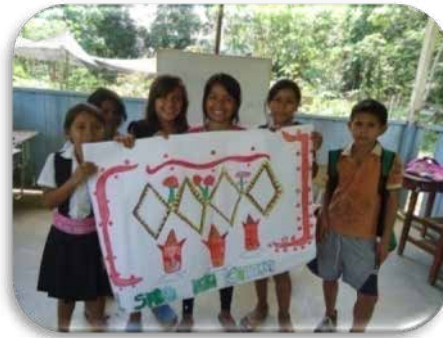
FOTO 12 Y 13: estudiantes del ciclo II, elaborando y exponiendo el ideograma, que representa los hongos en el territorio.

Al identificar que la producción de textos, se relaciona intrínsecamente con la elaboración de tejidos, en donde se expresa el significado, desde el momento de torcer el hilo, hasta la acción misma de urdir y tramar, entonces esto se relaciona con las formas de leer las realidades, utilizando los diferentes lenguajes de los Inga, como tallar, tejer, cantar, soñar, bailar, contar y cantar historias, y realizar nudos o – kipu- que reflejan la historia contada desde la palabra y el recorrido, siendo esta una forma muy valiosa de guardar memoria histórica, y establecer unos signos, característicos de la cultura Inga, y de la conformación de la comunidad desde tiempos inmemorables (Pueblo Inga, 2009) De acuerdo a esto, el pueblo Inga se caracteriza por tener un lenguaje simbólico con el cual se comunican teniendo en cuenta el uso de diferentes materiales vegetales e hilos con los cuales ellos traman y tejen el significado de su territorio y la continuidad de la vida (Pueblo Inga, 2012).