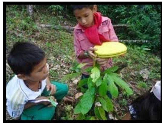
FOTO 9: Estudiantes del ciclo II, midiendo y dibujando las diferentes plantas sembradas en la chagra.

Para la organización de la actividad los estudiantes se organizaron en cuatro grupos, cada uno lleva sus materiales; la primera técnica utilizada era la observación de los seres y existencias como se muestra en la foto 7 , después dibujarlos en el cuaderno en relación al cuadrante que cada uno había escogido para realizar su interpretación de ese espacio; es importante resaltar el conocimiento que los estudiantes tiene en relación a las plantas que se siembran en el colegio, teniendo en cuenta que hay estudiantes nuevos, la capacidad de reconocer lo que ofrece un espacio determinado en relación al alimento, permite tener una relación intrínseca con el lugar en el cual se desarrollan diferentes pautas de aproximarse a la realidad, o de vivir el contexto que se despliega en la capacidad de sentir, pensar y actuar.