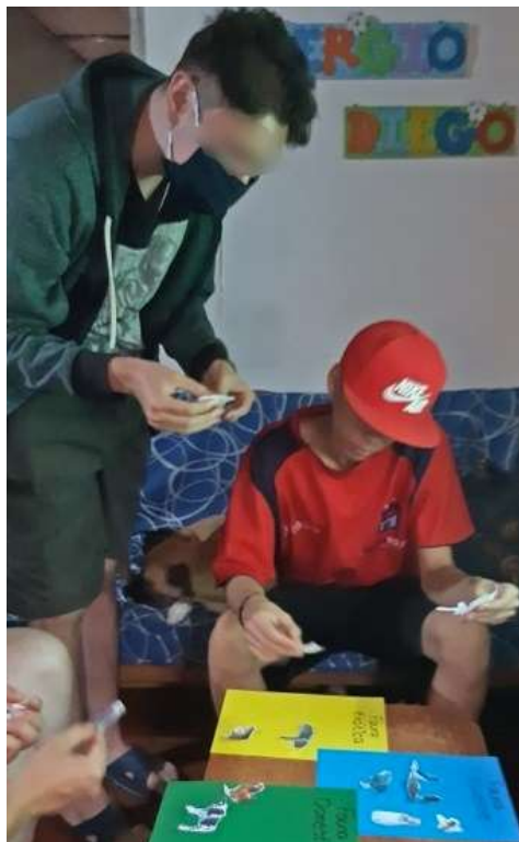
Figura 3 Participantes de Itagüí durante la intervención educativa

Posterior a la intervención educativa hubo una cierta transformación de conceptos, principalmente con la clasificación de la fauna y el reconocimiento de la importancia de esta. Un ejemplo con una de las participantes fue moldear su visión sobre el papel de las aves, ya que solo les proporcionaba características estéticas. Esto se redirigió reconociendo el papel de las aves en el esparcimiento de semillas, interacción con otros animales, posición en la cadena alimenticia, entre otras. La modificación podría significar una transformación en el comportamiento de esta participante en el momento en el que vaya a interactuar con alguna ave. Así también, un participante de Itagüí mencionó: "Yo creía que el conejo era un animal del bosque y ya, pero me di cuenta de que es doméstico". Implicando su nueva percepción de los conejos que implique, posiblemente, un comportamiento diferente. En la figura 3 se evidencia la interacción de algunos participantes del territorio de Itagüí con los materiales en la actividad "aprendizaje" que hizo parte de la intervención educativa.