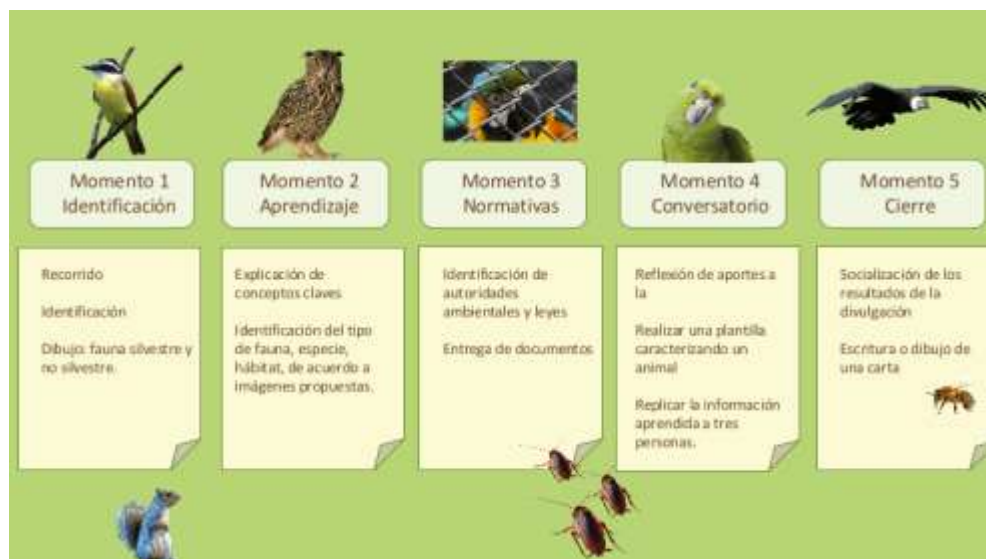
Actividades de la intervención educativa