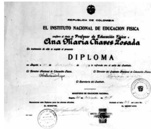
Figura 3. Diploma entregado a los primeros profesionales de la Educación Física colombiana.