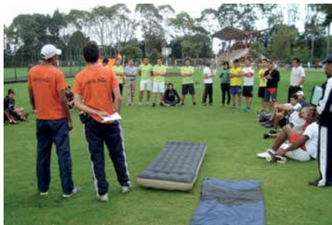
Figura 6. Clase de Campismo para docentes en formación en la Universidad Libre de Colombia sede Bosque Popular.

Actualmente, Colombia cuenta con 48 Instituciones de Educación Superior (distribuidas por la geografía nacional en 36 municipios y ciudades) debidamente autorizadas por el Estado, para ofertar un total de 84 programas de formación profesional en el campo de la Educación Física, Deporte, Recreación y campos disciplinares o de prácticas afines. Estos programas se distribuyen en los niveles de formación de la Educación Superior así: para el nivel Técnico Profesional, 9 programas; para el nivel Tecnológico, 18 programas, y para Profesional, 57 programas. En cuanto a la presencialidad, se cuenta con 79 programas con metodología presencial y 5 a distancia.