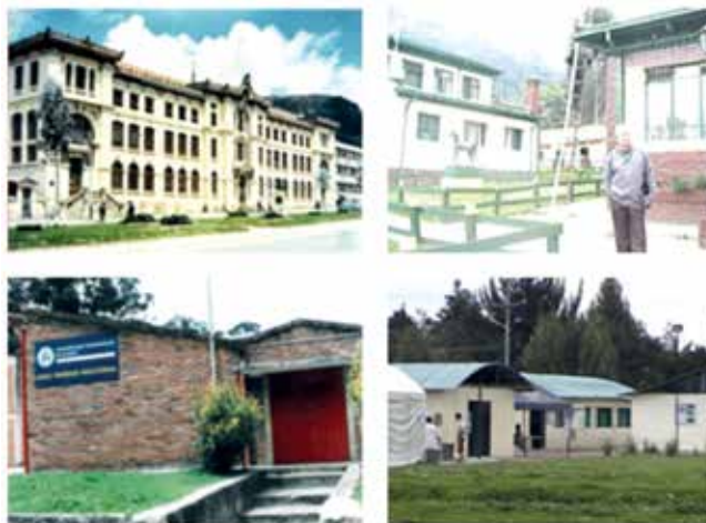
Figura 4. Mosaico de fotografías de algunas de las sedes de la Educación Física en Bogotá.