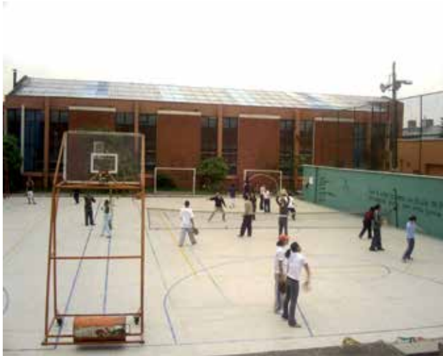
Figura 1. Clase de Tenis de campo para docentes en formación en la Universidad Pedagógica Nacional.