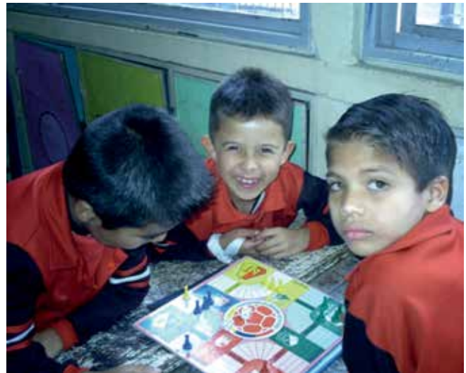
Figura 5. Clase de Educación Física Mental en el Colegio Distrital Rafael Uribe Uribe.