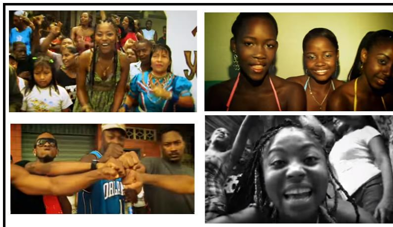
3. "Corpo sensual" – Pablllo Vittar (2017)